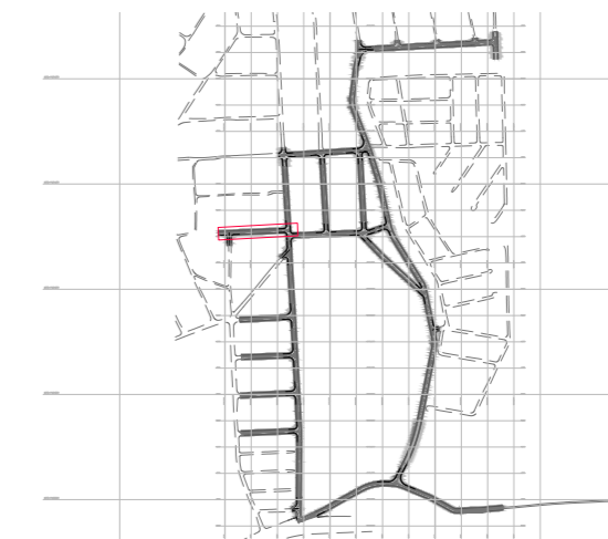
PERFIL LONGITUDINAL – Rua Quarenta e Cinco ESC.: H:1/500 V:1/50